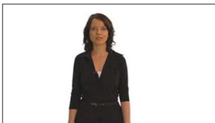
4. Halbtotale (Kopf bis Hüfte)