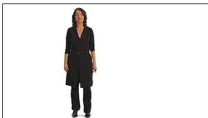
5. Totale (Kopf bis Füsse mit freiem Raum)

[Aus: Videoguide SF DRS, www.wissen.sf.tv ]