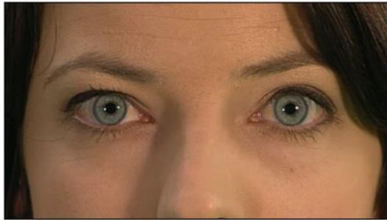
1. Detailaufnahme (Augen)

Wir unterscheiden fünf Einstellungsgrössen :