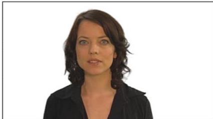
3. Nahe (Gesicht bis Schulter)