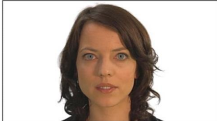
2. Grossaufnahme (Gesicht)